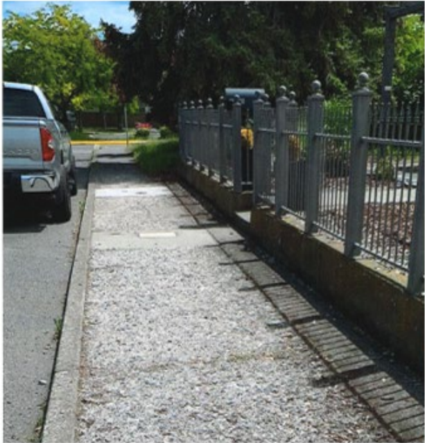
Antes de la rehabilitación de la acera