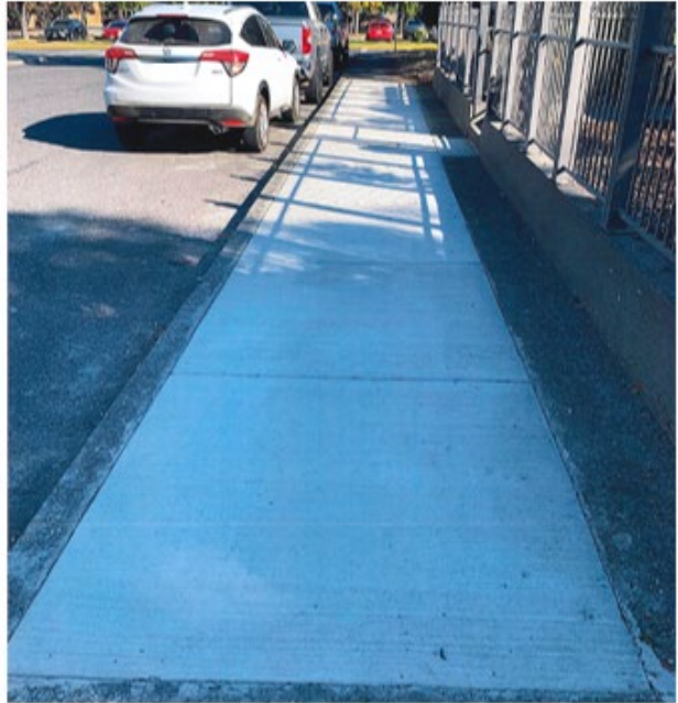
Después de la rehabilitación de la acera

El monto que la Ciudad compartirá con los costos es variable según el tipo de propiedad: